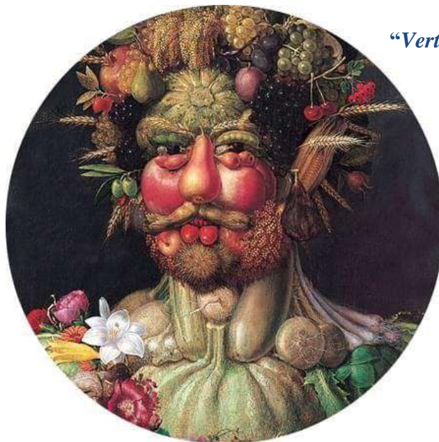
“Vertumno” olio su tavola di Arcimboldo, 1590