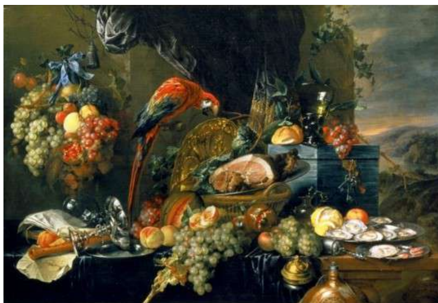
Figura 1 Suntuosa natura morta con pappagallo - Jan Davidz. De Hemm

Servizio sportello: Tel. 02.67382158- Fax 02.67382177 e-mail: segreteria@aicqcn.it